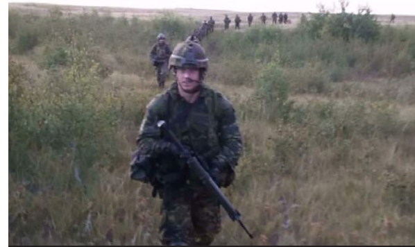
Rangée de troupes se déplaçant vers leur objectif de raid.

Ce printemps, des experts en la matière se réuniront avec les membres du personnel de recherche des PSP en vue de concevoir des « scénarios » comme « une évacuation pour courir aux abris » et « l'érection d'un mur de sable aux fins d'aide alimentaire ». Par la suite, nous visiterons des bases navales, aériennes et de l'Armée de terre à l'échelle du pays afin de soumettre environ 16 participants militaires à chacun des scénarios, au cours desquels nous mesurerons une variété de réponses physiologiques, y compris la fréquence cardiaque et la consommation d'oxygène. Lorsque nous saurons quelles bases nous visiterons, nous aurons besoin de votre aide en 2011 pour entreprendre ces essais. Il s'agira d'une belle expérience de recherche et d'une occasion pour vous de voir ce que les membres du personnel de recherche des PSP sont appelés à faire!